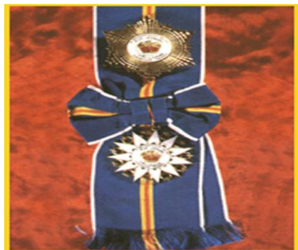
Panglima Mangku Negara (P.M.N)