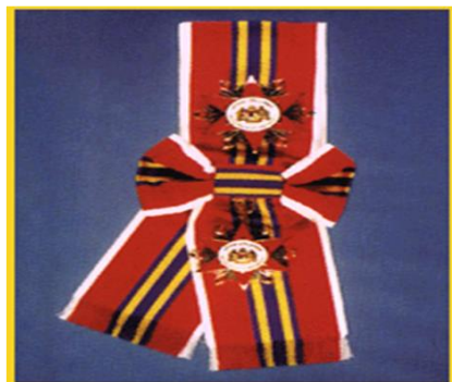
Panglima Jasa Negara (P.J.N)