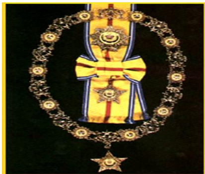
Darjah Utama Seri Mahkota Negara (D.M.N.)