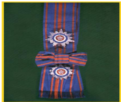
Panglima Setia Mahkota (P.S.M)

YBhg IG Tan Sri Dato' Sri Khalid bin Abu Bakar