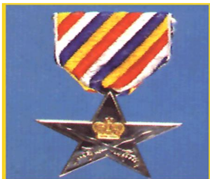
Panglima Gagah Berani (P.G.B.)