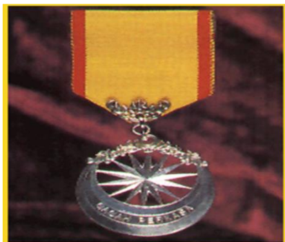
Seri Pahlawan Gagah Perkasa (S.P.)