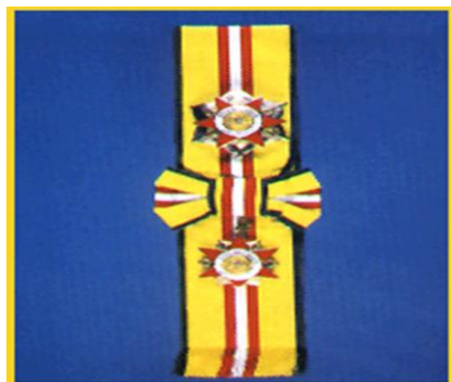
Panglima Setia Diraja (P.S.D)